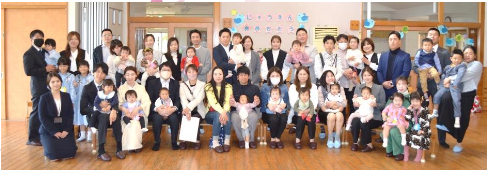
歓迎会 新しい友だちを19名迎えました